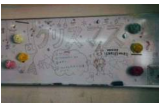
クリスマスカード