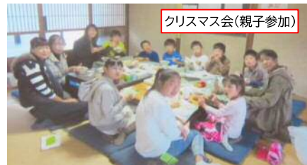
クリスマス会(親子参加)

苅安賀公民館でクリスマス会。オセロクイズと紙飛行機大会をしました。暖かい太陽の元、外で飛ばした紙飛行機。折り方が分からない子、試作品をたくさん作った子、様々でしたが子どもたちの笑顔が忘れられない会となりました。