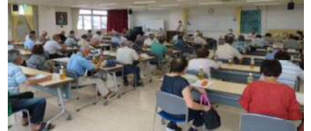
大和老連クラブ長会

ところで、大和老連は、一宮市(23連区)の中で最大級の組織「老人クラブ数は1番多い46クラブ、会員数は2番目に多い2,410人(令和2年4月現在)」となっています。しかし、会員の方は毎年減少傾向にあり、また加入率も一宮市平均を下回る状況となっています。会員になって、一緒に充実した時間を過ごしませんか。概ね60歳以上の方なら、原則としてどなたでも加入していただけます。(入会に関するお問い合わせは、地域の老人クラブ長さんまで)