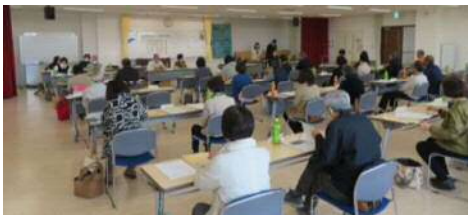
大和町連区民生委員児童委員協議会定例会