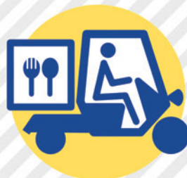
デリバリー・ テイクアウトの利用