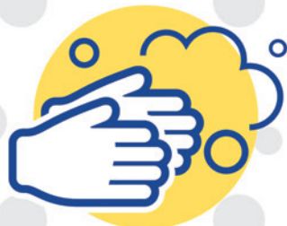
手洗い・ 手指消毒の徹底