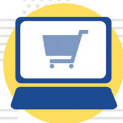
ネット通販の利用