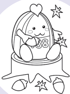
一宮市マスコットキャラクター 「いちみん」