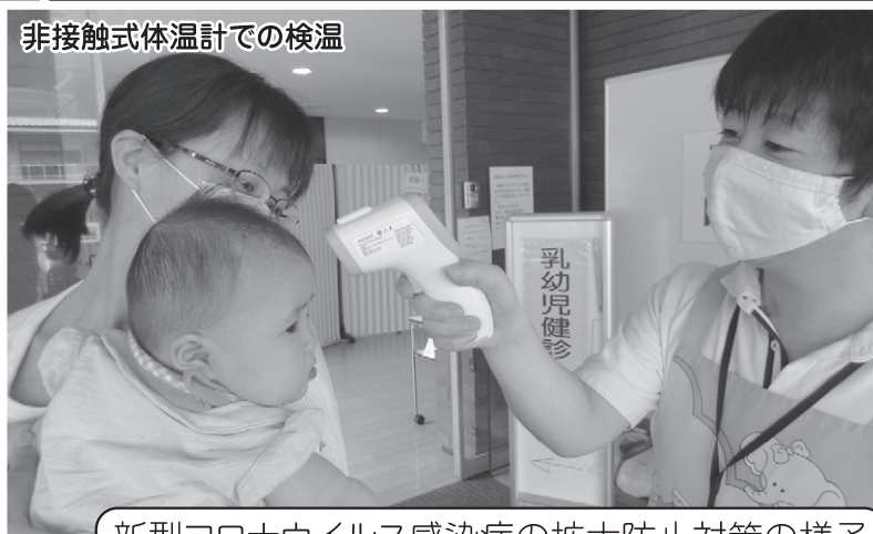
新型コロナウイルス感染症の拡大防止対策の様子