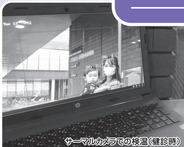
サーマルカメラでの検温(健診時)