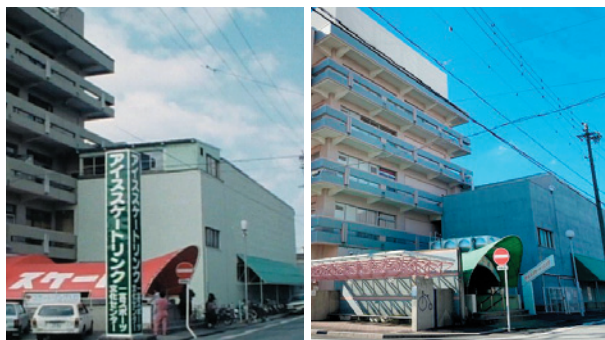
(左:市政ニュースより 昭和62年3月 右:現在のスケート場)

今回は真清田神社北にある「一宮市スケート場」を紹介します。昭和40年4月「教養と文化の殿堂」として開館した中小企業福祉センターの1階に開場。自治体主体のスケート場としては愛知県下では、名古屋市・豊橋市・長久手市(県)そしてここ一宮市。市民に愛されている人気スポットのひとつです。利用者数は平成29年度が43,540人、30年度が36,752人。シーズン中、年末年始の真清田神社へのご参拝帰り、冬休みの間が特に賑わいます。今年はコロナの影響で子供たちの遊びの場が限られていますが、