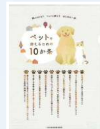
飼う前に考えよう クリアファイル

動物愛護週間だけでなく、譲渡会や保健所の窓口などで配布している動物愛護啓発のための資料も、皆様の寄附金を活用して作りしました。