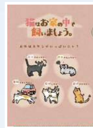
猫の室内飼育推奨 クリアファイル