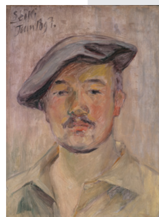
黒田清輝「自画像」1897年(久米美術館蔵)