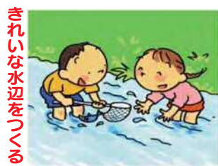
きれいな水辺をつくる

家のまわりに汚れた水がたまりにくく、悪臭や蚊、ハエの発生を防ぎます。(絵中、黒丸はマンホールのふた)