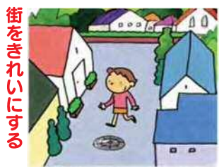
街をきれいにする

くみ取り便所は、悪臭やくみ取りの煩わしさが解消されます。浄化槽は、維持管理が不要になります。