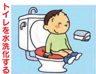
トイレを水洗化する

くみ取り便所は、悪臭やくみ取りの煩わしさが解消されます。浄化槽は、維持管理が不要になります。