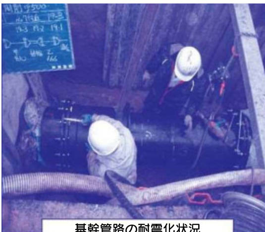
基幹管路の耐震化状況

水道施設を新しくするには、多くの費用が必要です。そのため一宮市では、基幹管路である水源から浄水場までを結ぶ導水管、浄水場と家庭までを結ぶ配水本管(一宮市では口径400mm以上の配水管)に加えて、災害拠点病院・避難所及び防災拠点など、重要給水施設に至るルートの配水管について優先的に耐震化を進めています。