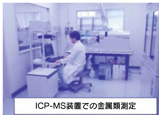
ICP-MS装置での金属類測定

このように職員が自ら検査できる水道事業は、愛知県内では、愛知県企業庁、名古屋市をはじめ豊田市、岡崎市など数都市にしかありません。他都市の水道事業は、一部項目の検査を行います、その他の項目は外部の水質検査機関に委託しています。