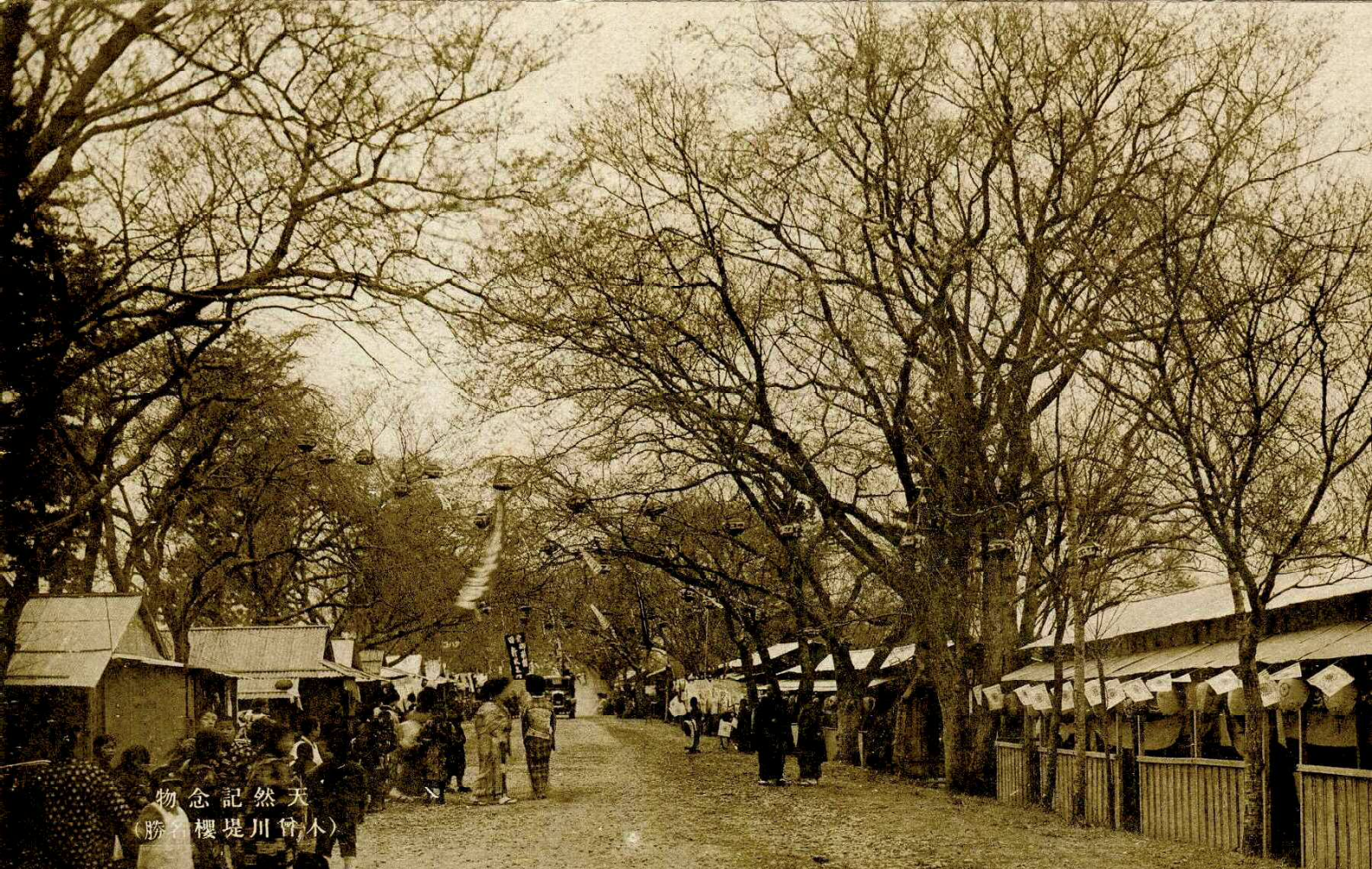
物念記然天 (勝名櫻堤川曾木)