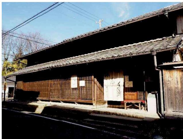
旧湊屋店舗兼主屋