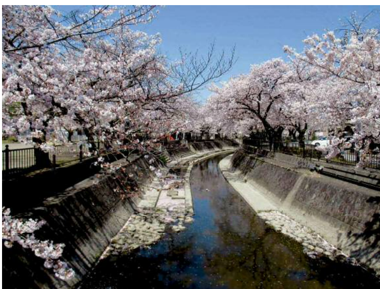
大乘公園付近大江川の桜並木