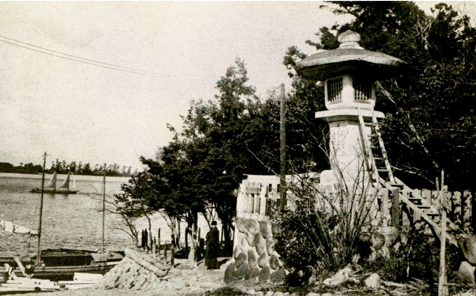
起渡船場（大正 6 年撮影）