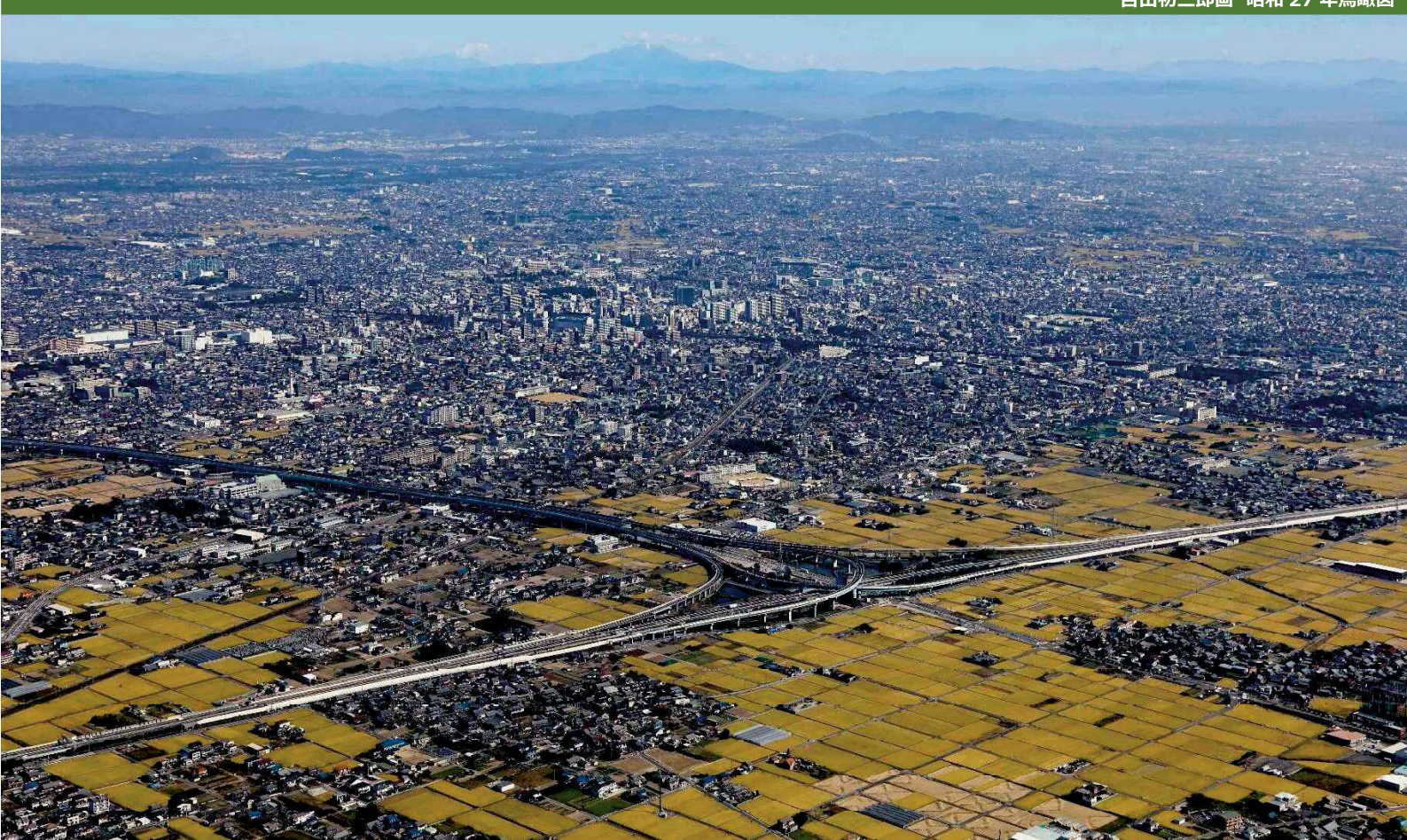
平成27年撮影 航空写真