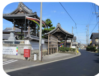
現在の宝行寺前付近の様子