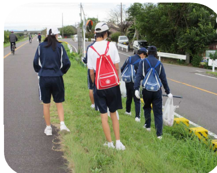
いざ、ゴミを探しに！