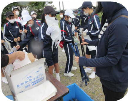
ゴミ袋と金ばさみをもらって～