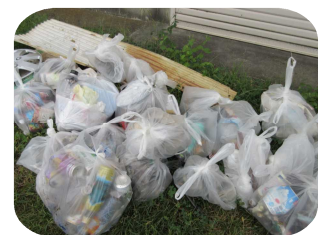
トタン板や車のホイールまでいろいろなゴミが！