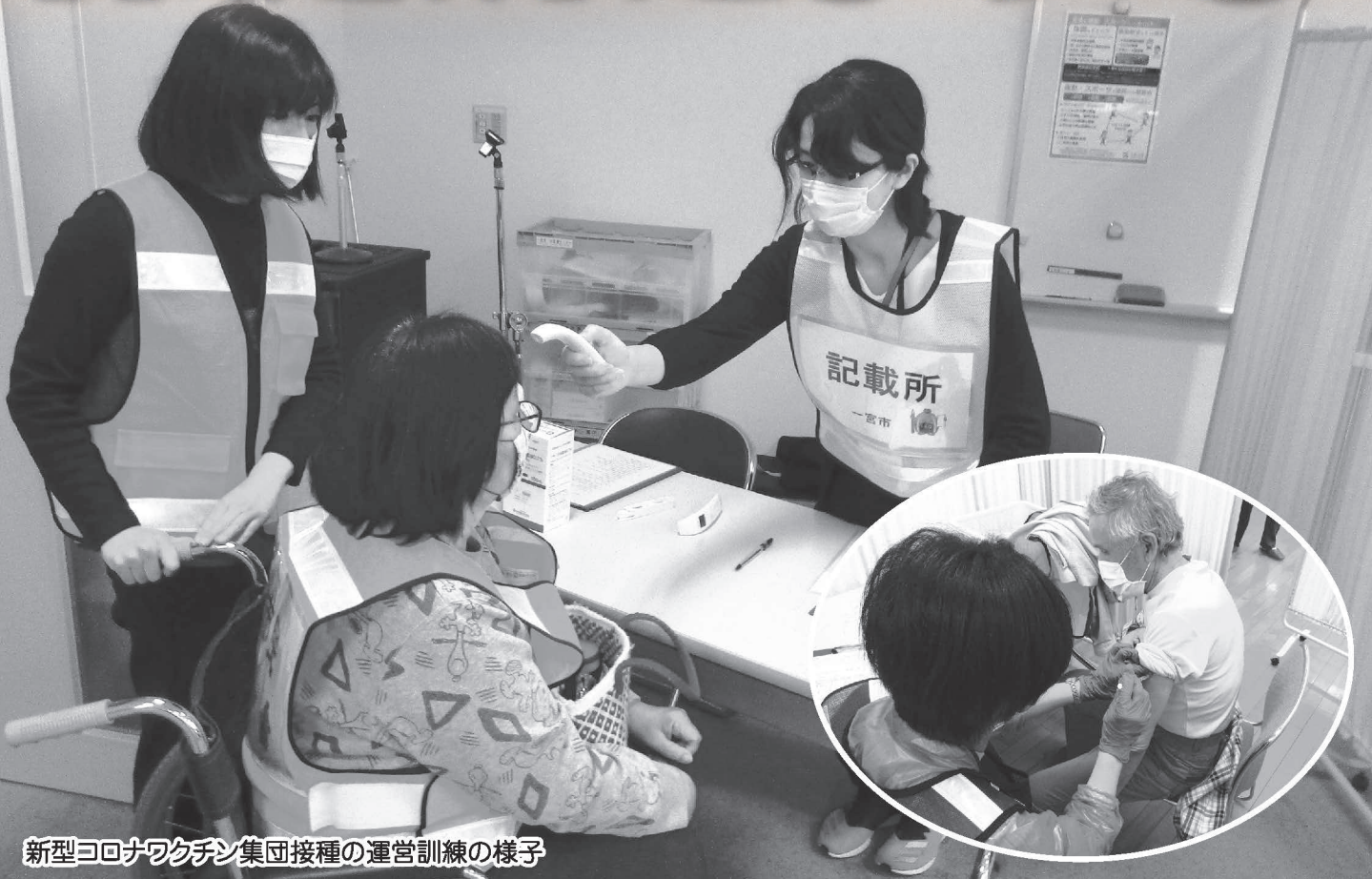
新型コロナワクチン集団接種の運営訓練の様子

令和3年4月1日に一宮市が中核市に移行し、「一宮市保健所」を開設したことにあわせ、今回から、「健康ひろば」を『保健所だより』にリニューアルしました！