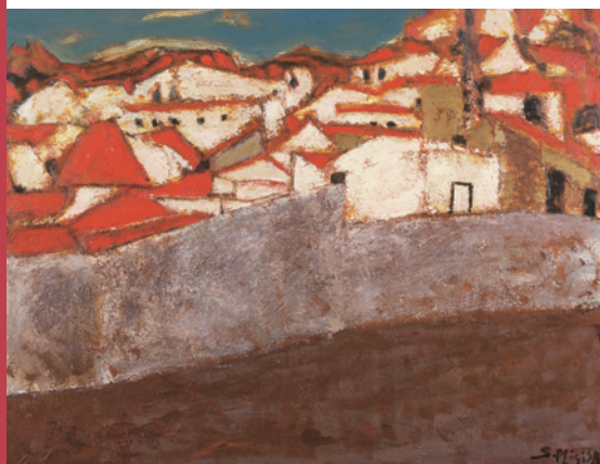
▲「小さな町(アンダルシア)」1987年©MIGISHI