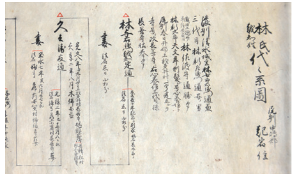
▲越智姓林家代々系図

対象/市内在住・在勤・在学の方 定員/各24人(抽選) 受講料/各500円 申し込み/7月11日(日)(必着)までに郵便番号・住所(在勤・在学は勤務先・学校所在地)・氏名(ふりがな)・年齢・電話番号・受講希望の講演会番号を記入し「ルーツをたどる講演会」と明記の上、ハガキ(〒494-0006 起字下町211 歴史民俗資料館)。申し込みは1枚1人分