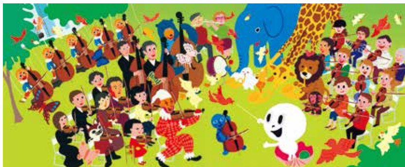
絵本『おばけのマーブルとちいさなびじゅつかん』原画 2008年