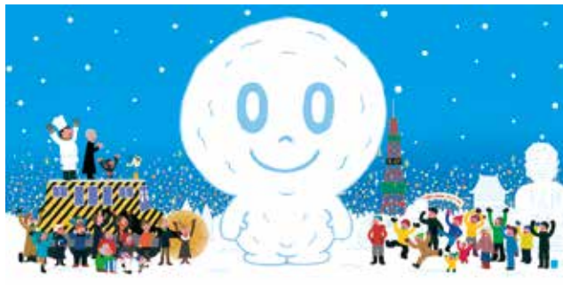
絵本『おばけのマーブルとゆきまつり』原画 2006年