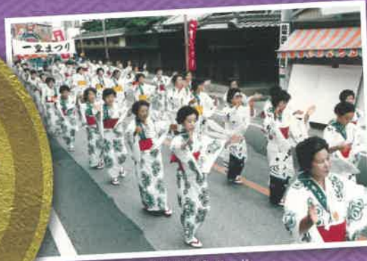
第1回戦国パレード