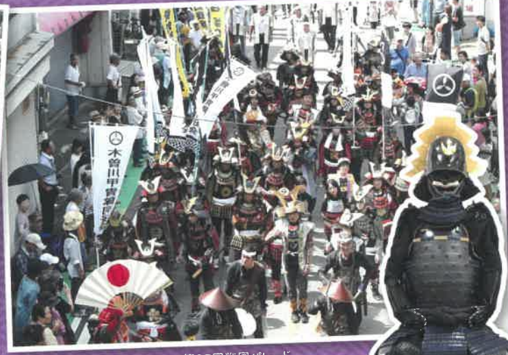
第35回戦国パレード