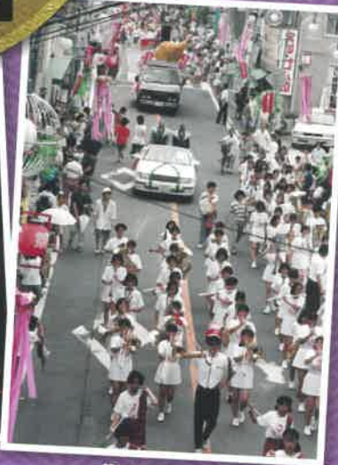
第10回戦国パレード