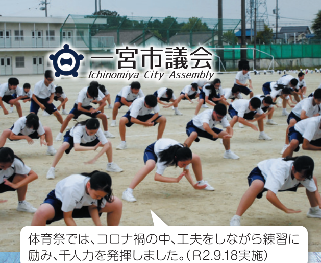
体育祭では、コロナ禍の中、工夫をしながら練習に励み、千人力を発揮しました。(R2.9.18実施)