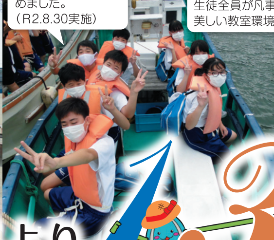
修学旅行では、班別行動などを行うことで、仲間との輪を強めました。(R2.8.30実施)