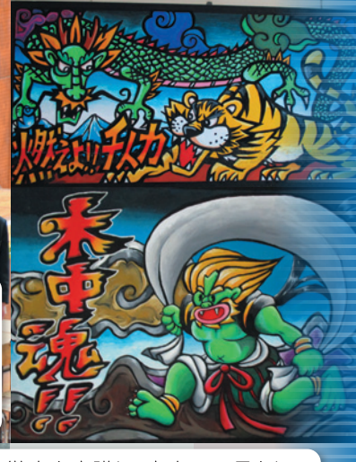
生徒全員が凡事徹底を意識し、木中の一員として美しい教室環境で学校生活を送っています。