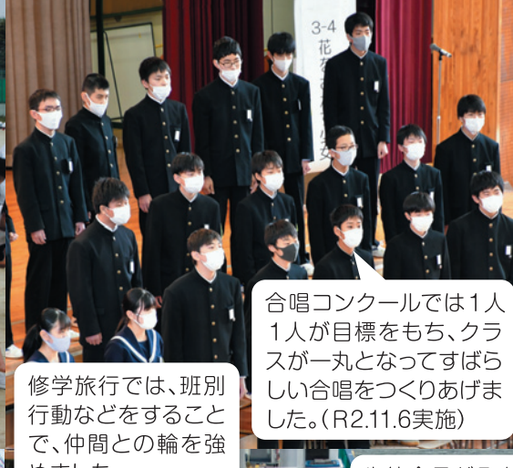
合唱コンクールでは1人1人が目標をもち、クラスが一丸となってすばらしい合唱をつくりあげました。(R2.11.6実施)