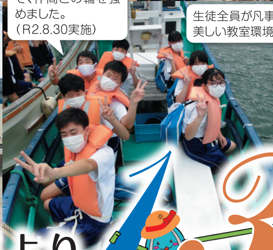
修学旅行では、班別行動などを行うことで、仲間との輪を強めました。(R2.8.30実施)