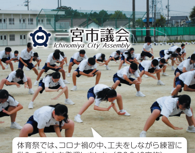
体育祭では、コロナ禍の中、工夫をしながら練習に励み、千人力を発揮しました。(R2.9.18実施)