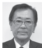
高木 宏昌 (自由民主党-真会)