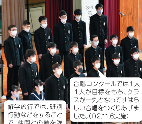
合唱コンクールでは1人1人が目標をもち、クラスが一丸となってすばらしい合唱をつくりあげました。(R2.11.6実施)