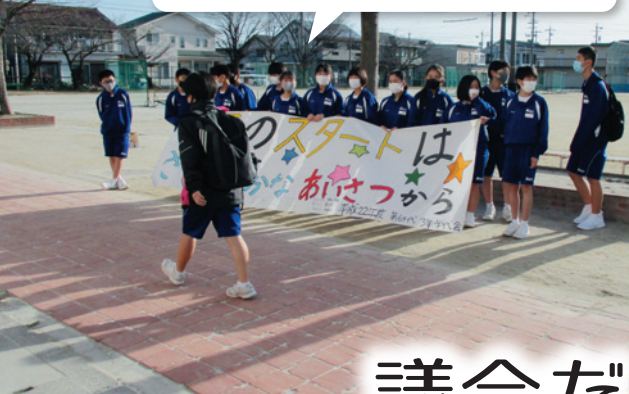
感染症対策を意識しながら、生徒全員が気持ちのよいあいさつをしています。