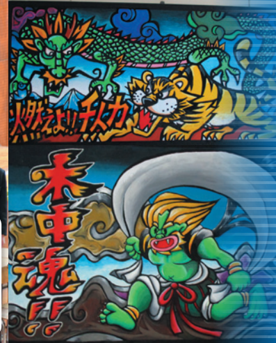
生徒全員が凡事徹底を意識し、木中の一員として美しい教室環境で学校生活を送っています。