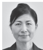
森 ひとみ (自由民主党-真会)