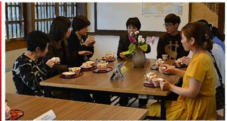
お茶を飲みながらベトナムの象に思いを馳せる