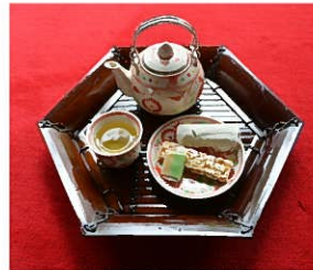
ベトナムのお茶とお菓子

旧林家住宅給湯室の手洗いや排水設備、棚、冷蔵庫などを整備し、年間を通じて来館者に抹茶などを呈茶できるようにする。