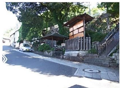
参考：中山道中津川宿