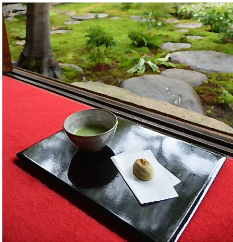
庭園を眺めながら一服

旧林家住宅給湯室の手洗いや排水設備、棚、冷蔵庫などを整備し、年間を通じて来館者に抹茶などを呈茶できるようにする。