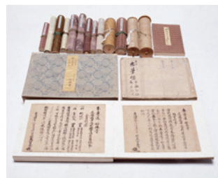
▲ 国指定重要文化財 「妙興寺文書」 (妙興寺蔵・博物館寄託)