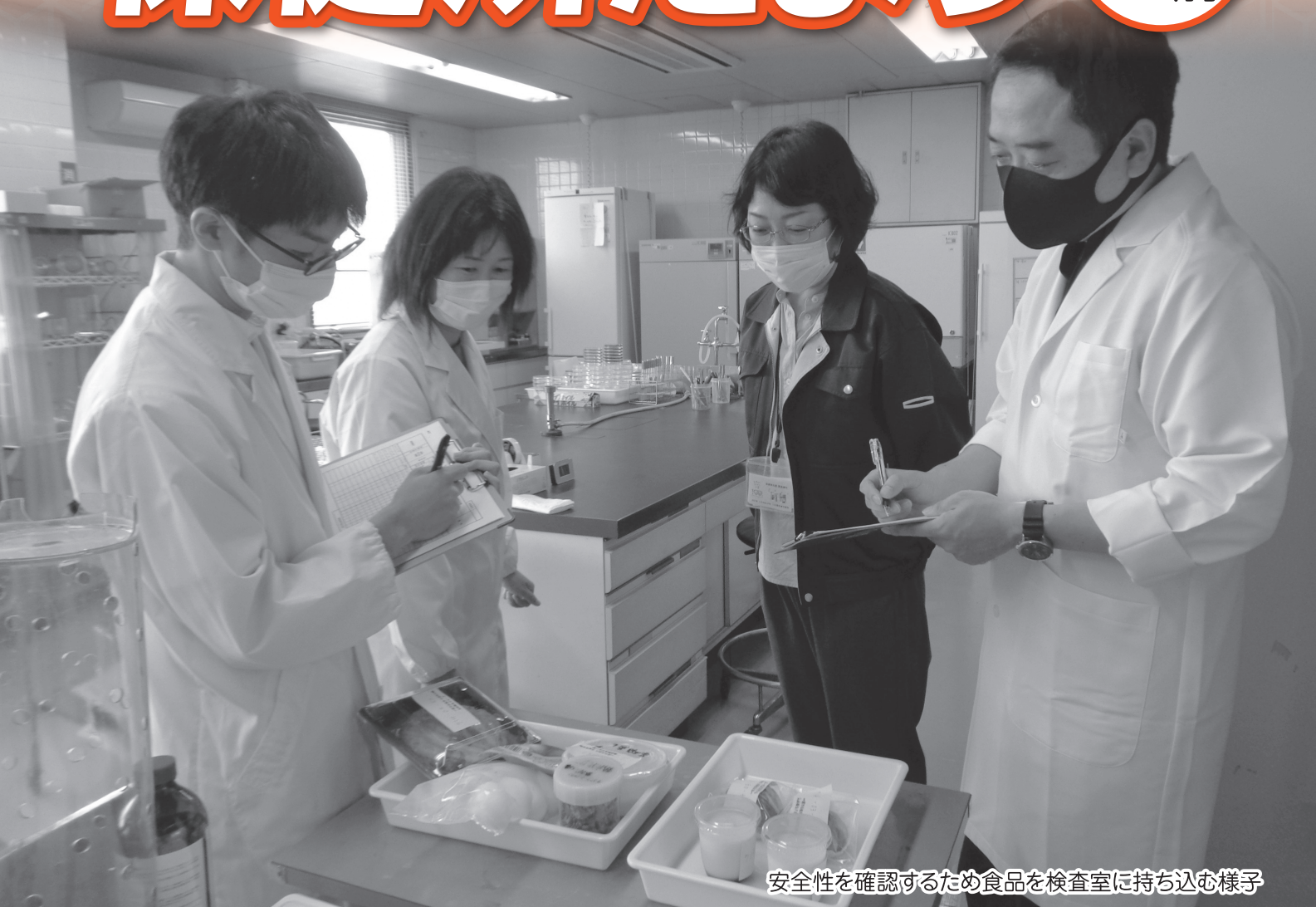
安全性を確認するため食品を検査室に持ち込む様子