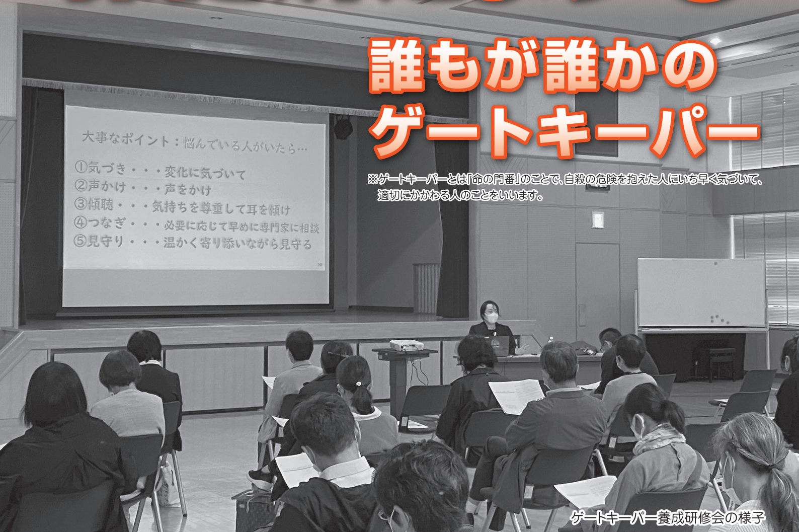
ゲートキーパー養成研修会の様子