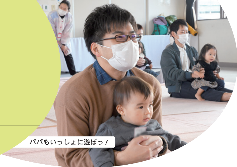
パパもいっしょに遊ぼう！

中央 ☎(85)7026 丹陽 ☎(28)9146 千秋 ☎(28)9771 東五城 ☎(85)9339 黒田北 ☎(28)9769 里小牧 ☎(28)9770