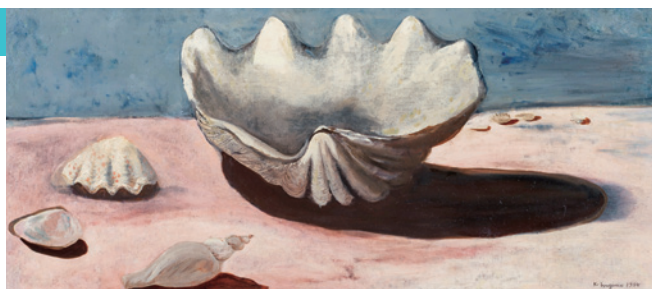
▲「のんびり貝」1934年(北海道立三岸好太郎美術館蔵)