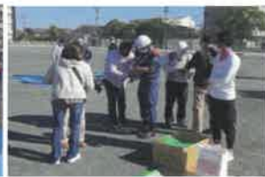
けがに対する応急手当講習