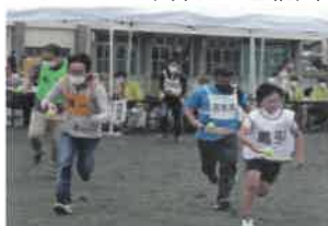
テニスボールリレー