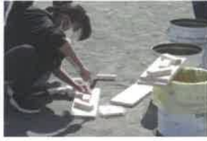
簡易トイレ作り講習