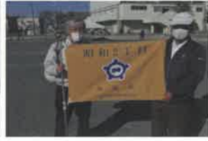
昭和2丁目自主防災会会旗