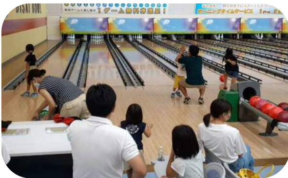
親子で楽しくボーリング