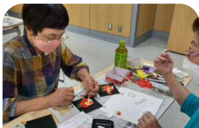
タペストリー作りに挑戦