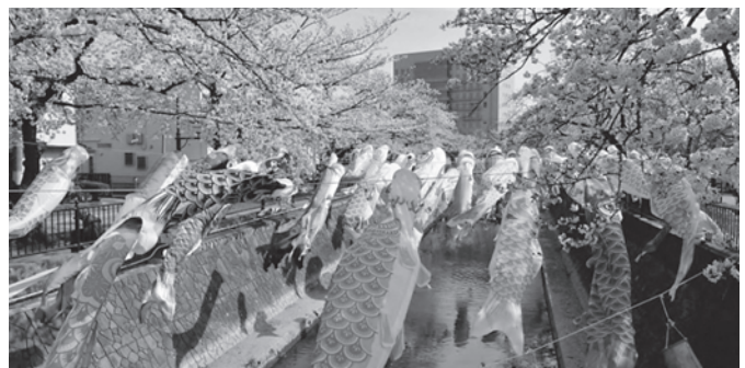
大江川の桜とこいのぼり