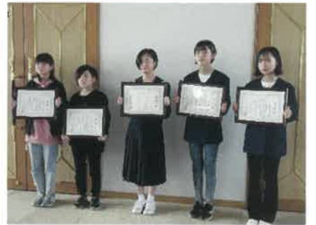
児童・生徒の部の表彰者