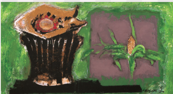
▲「とうもろこしと魚」1963年©MIGISHI

節子の作品の中には、素朴でありながらユニークな形をした動物たちが登場します。動物たちの姿や花の形に注目して、作品を見てみましょう。