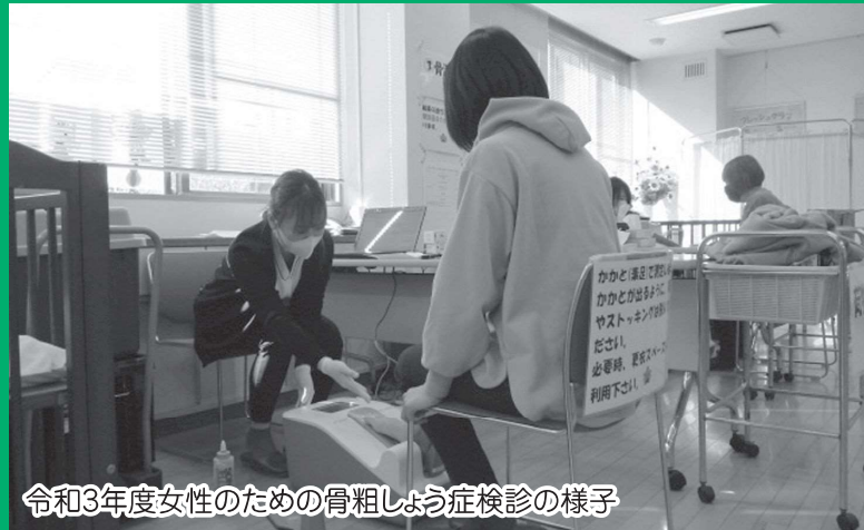
令和3年度女性のための骨粗しょう症検診の様子

一宮市では20歳から70歳の5歳ごとの節目年齢の女性を対象とした「女性のための骨粗しょう症検診」を毎年実施しています。