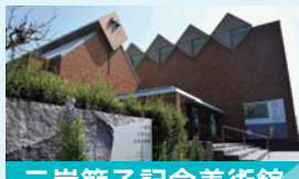
三岸節子記念美術館