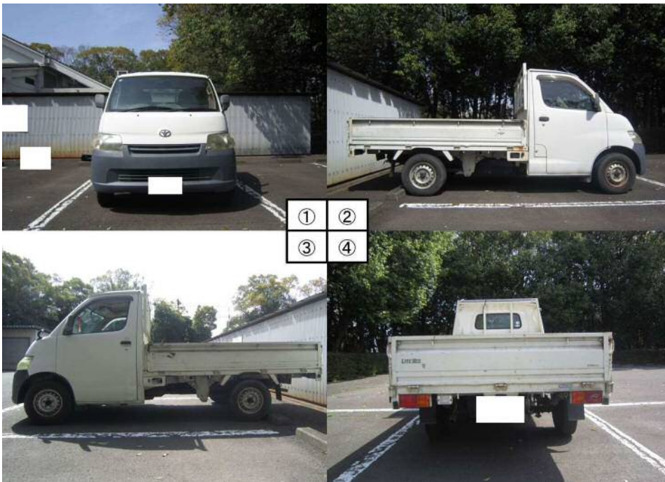
①前 ②右側 ③左側 ④後