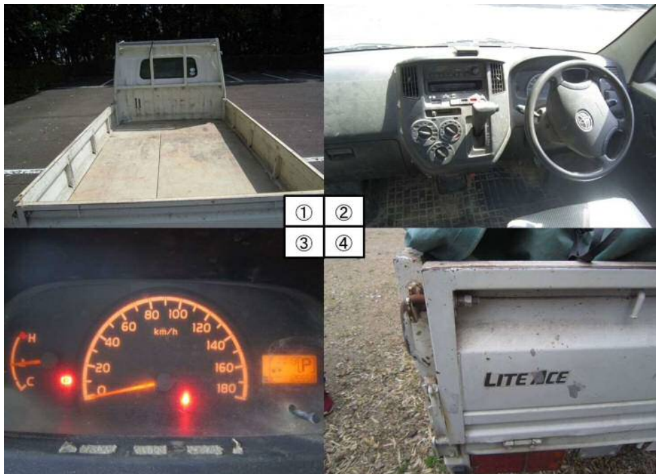
①荷台 ②ダッシュボード ③メーターパネル ④リヤエンブレム