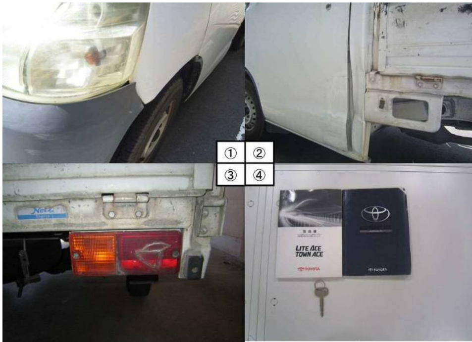
①左前バンパーゆがみ ②左ドアへこみ ③右テールランプ割れ ④付属品