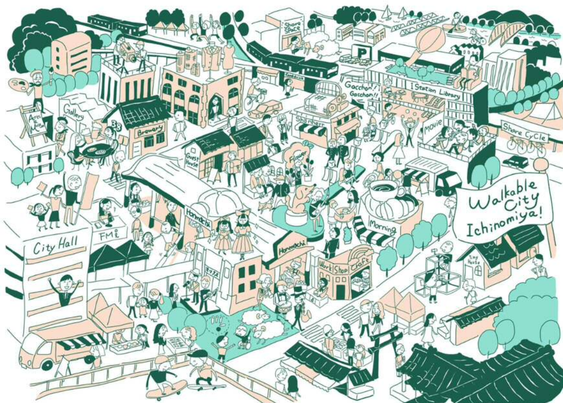
2021 社会実験から生まれた まちなかのイメージ

今まで行った社会実験の結果を踏まえ、将来の新しいまちなかの風景に向けてどんな事が必要か、それらの想いを一宮まちなか未来会議が「未来ビジョン」として取りまとめます。