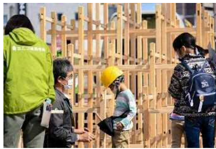
ストリートチャレンジ 2021 (3days) … 19 プログラム/約 9000 人の来場