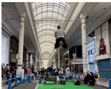
ストリートチャレンジ 2022 (3days) … 36 プログラム/約 18,000 人の来場