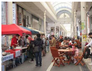
ストリートチャレンジ 2022 (365days) … 12 プログラム