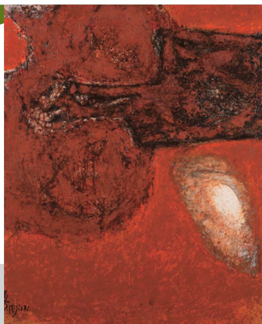
▲「火の山にて飛ぶ鳥(軽井沢山荘にて)」 1960年©MIGISHI

マチエールとは、画家の創意によって生み出された画面の肌合いや質感のことを指します。初期の軽妙な薄塗りの室内画から、後期の重厚に描かれた風景画まで、さまざまなマチエールの魅力を伝えます。