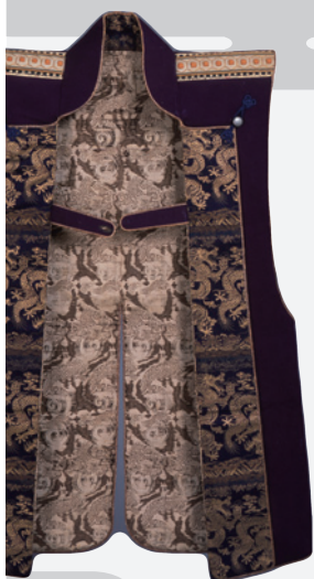
▲紫羅紗地三葉葵紋陣羽織