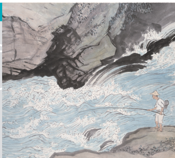
▲「鮎釣」1955年(個人蔵・博物館寄託)

木曾川町出身で独特の詩情あふれる画風を確立した日本画家・川合玉堂(1873～1957)。展覧会では、四季折々の情景を描いた作品を紹介します。