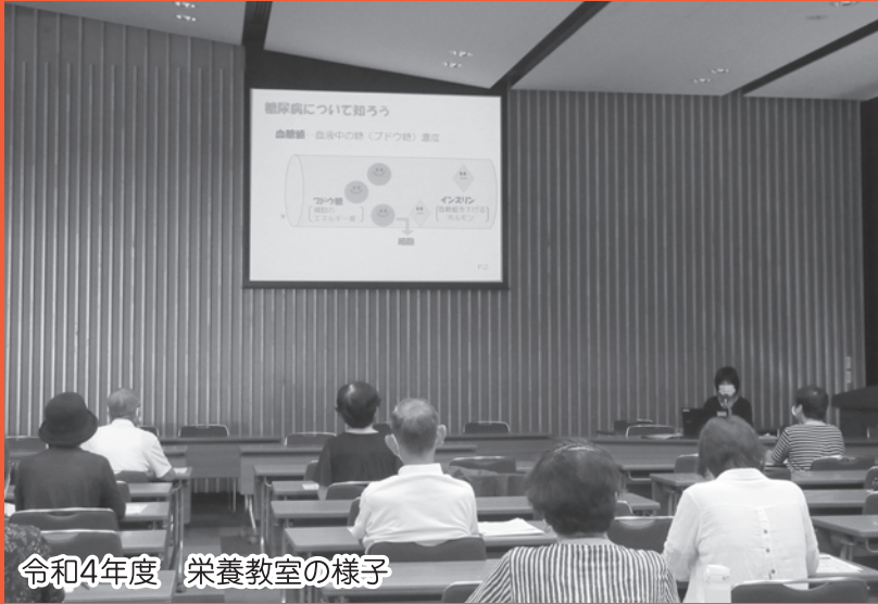
令和4年度 栄養教室の様子

一宮市では、食べることの大切さや正しい食知識の普及を図るために「からだにやさしい栄養教室」を開催しています。