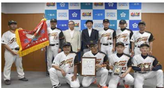
□7月10日(月)市役所 表敬訪問