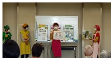
★バランス食の説明