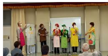
★食ボラさんの寸劇