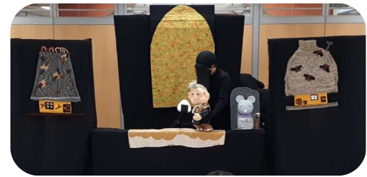
人形劇楽しんだよ！