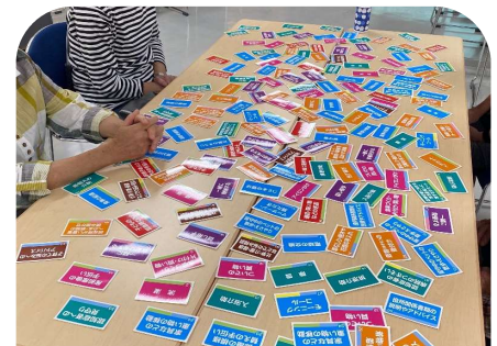
カードで助け合い体験ゲーム