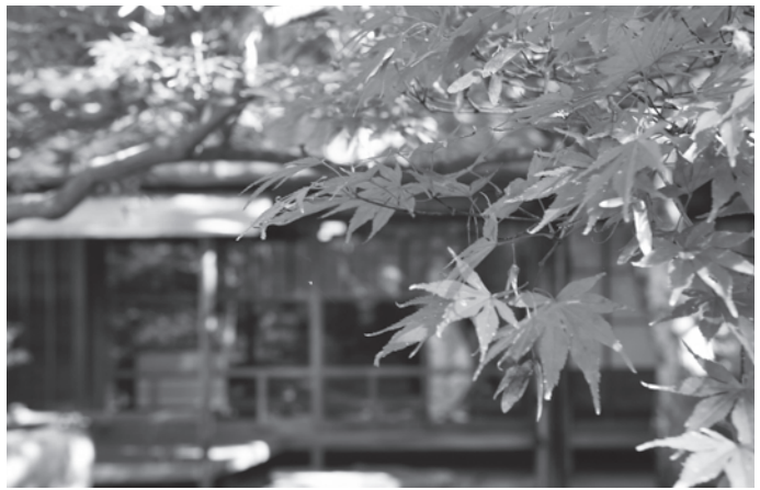
紅葉と旧林家住宅（尾西歴史民俗資料館別館）