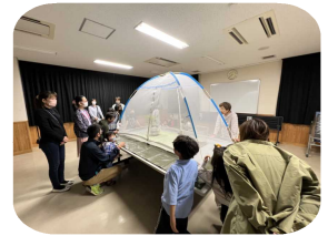
オスは波長の合うメスを求めて光るそうです！