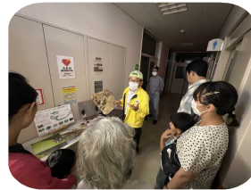
平成ホテルの会の方からホテルの生態のお話を聞きました！