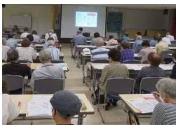
演題:チェックしながら家庭で防災

参加者のみなさんのご協力もあり、ほぼ予定通り公民館に全員無事に帰ることができました。ありがとうございました。