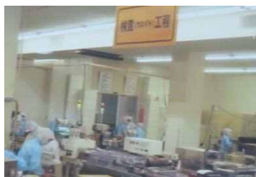
そば製造過程見学