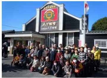
カクキュー八丁味噌の里

来年も9月の最終火曜日から開催の予定です。お誘いあわせの上、多くの方のご参加をお待ちしております。