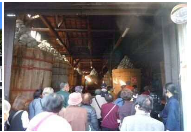
味噌醸造蔵の内部