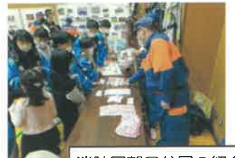
消防団朝日分団の紹介