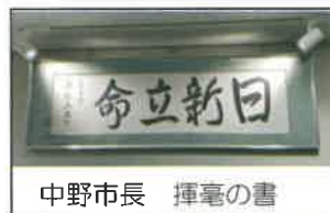
中野市長 揮毫の書