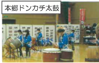
本郷ドンカチ太鼓