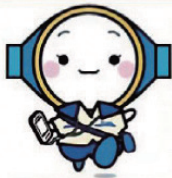
当社オリジナルキャラクター 水果(みく)ちゃん

上下水道の使用開始・中止等の 受付業務、メーター検針業務、 水道料金等の収納業務等 を行っています。 どうぞよろしくお願い致します。