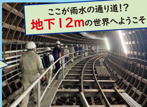
雨水貯留管内部の見学の様子(令和4年9月)

詳細については、水de報や一宮市の広報、ウェブページ等でご案内しますので、乞うご期待!!