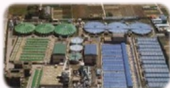
西部浄化センター 昭和39年処理開始