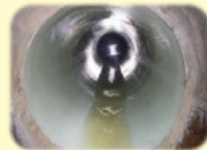
更新後の下水道管