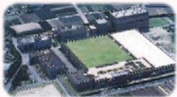
東部浄化センター 昭和35年処理開始