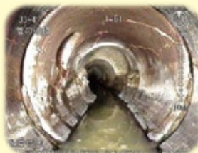
老朽化した下水道管