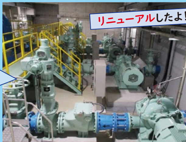
佐千原浄水場のポンプ室