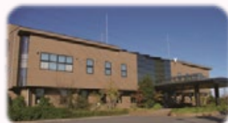
日光川上流浄化センター