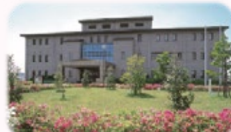
五条川右岸浄化センター