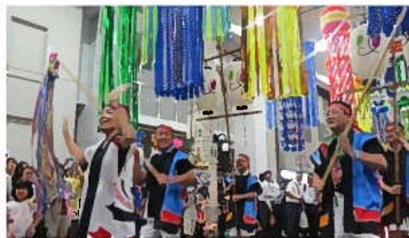
令和元年度金賞「いちい信用金庫連」(写真は平成30年度)

10名以上のチームで「ワッショーーいちのみや」の曲に合わせて自由な振り付け・衣装で踊ろう！ 参加希望の方は、下記申込書にて6月8日(木)までにお申し込みください。詳しくは裏面の参加要項をご覧ください。