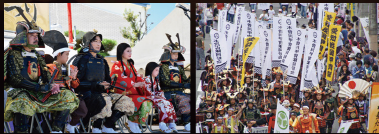
過去の一豊まつりパレード主役の皆さま