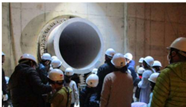
貯留槽への流入管