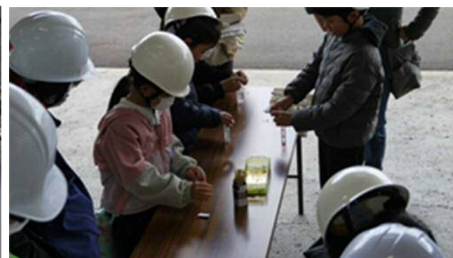
塩素濃度測定体験