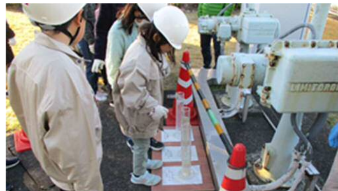
流入水・処理水透視度確認