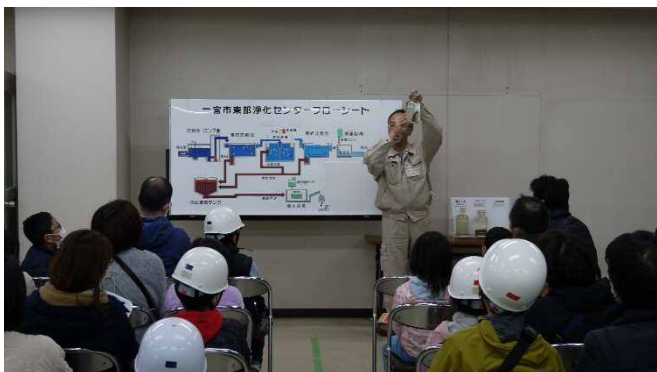
汚水処理設備について説明