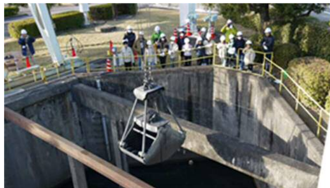
橋形クレーン操作見学