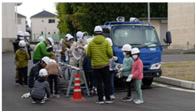
給水袋への給水・運搬体験