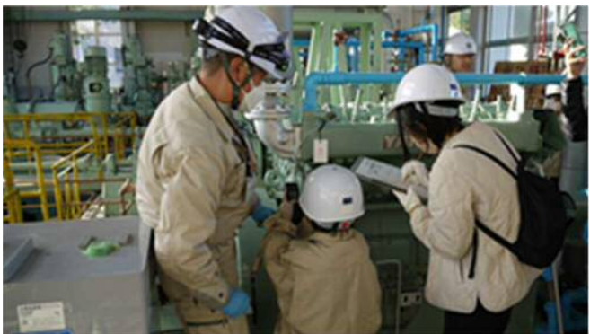
雨水エンジン点検体験