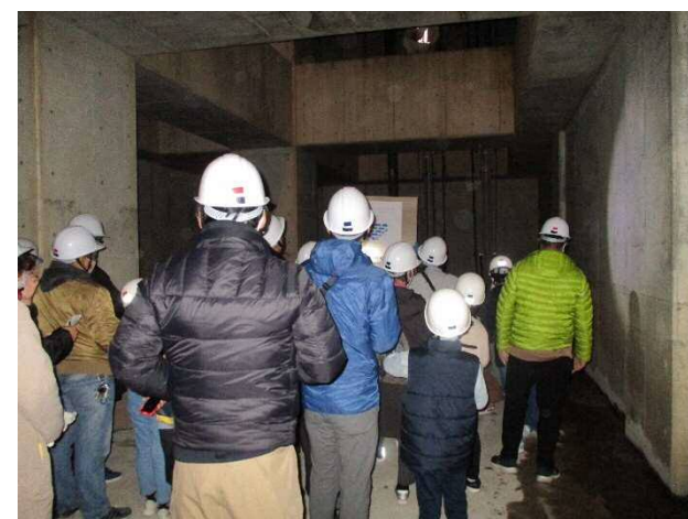
地下29mの貯留槽底部