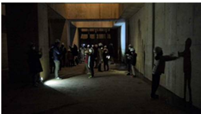
地下29mの貯留槽底部