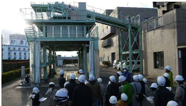
汚泥処理設備について説明