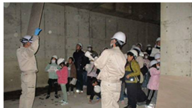
貯留槽内部での説明