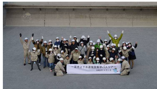
雨水滞水池で集合写真