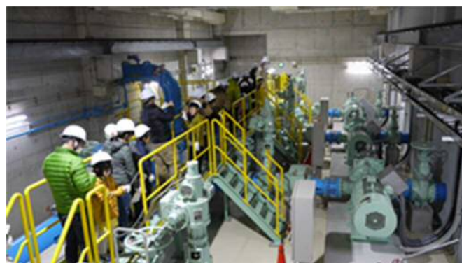
ポンプ棟内部見学