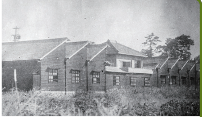
▲毛織工場の写真(個人蔵)