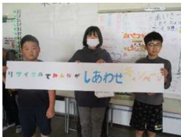
「リサイクルでみんながしあわせキャンペーン」