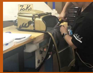
ランドセルリメイクの様子