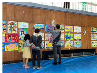
写真：ニコニコふれあいバス記念感謝デー

このような取り組みは、地域の活性化にも寄与するものと考えます。新たな地区での協議会の組織づくりや新しい公共交通の運行に向けた地域の取り組みを支援します。