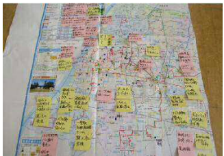
写真：住民懇談会（グループワーク）