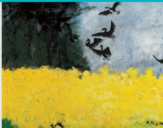
▲「ブルゴーニュにて」1989年◎MIGISHI

「色彩が快い詩を唄ひださなくては絵画は軌道に乗らない」と語り、色彩の重要性を説いた節子。さまざまな色彩が奏でる節子の「詩」を紹介します。